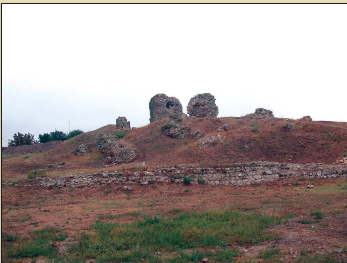
Carsium, incintele de vest