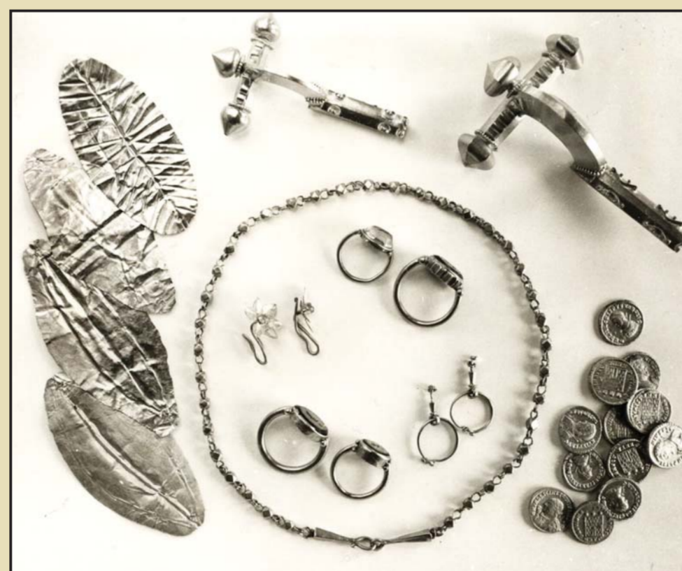
Piese de aur descoperite în necropola romană de la Carsium