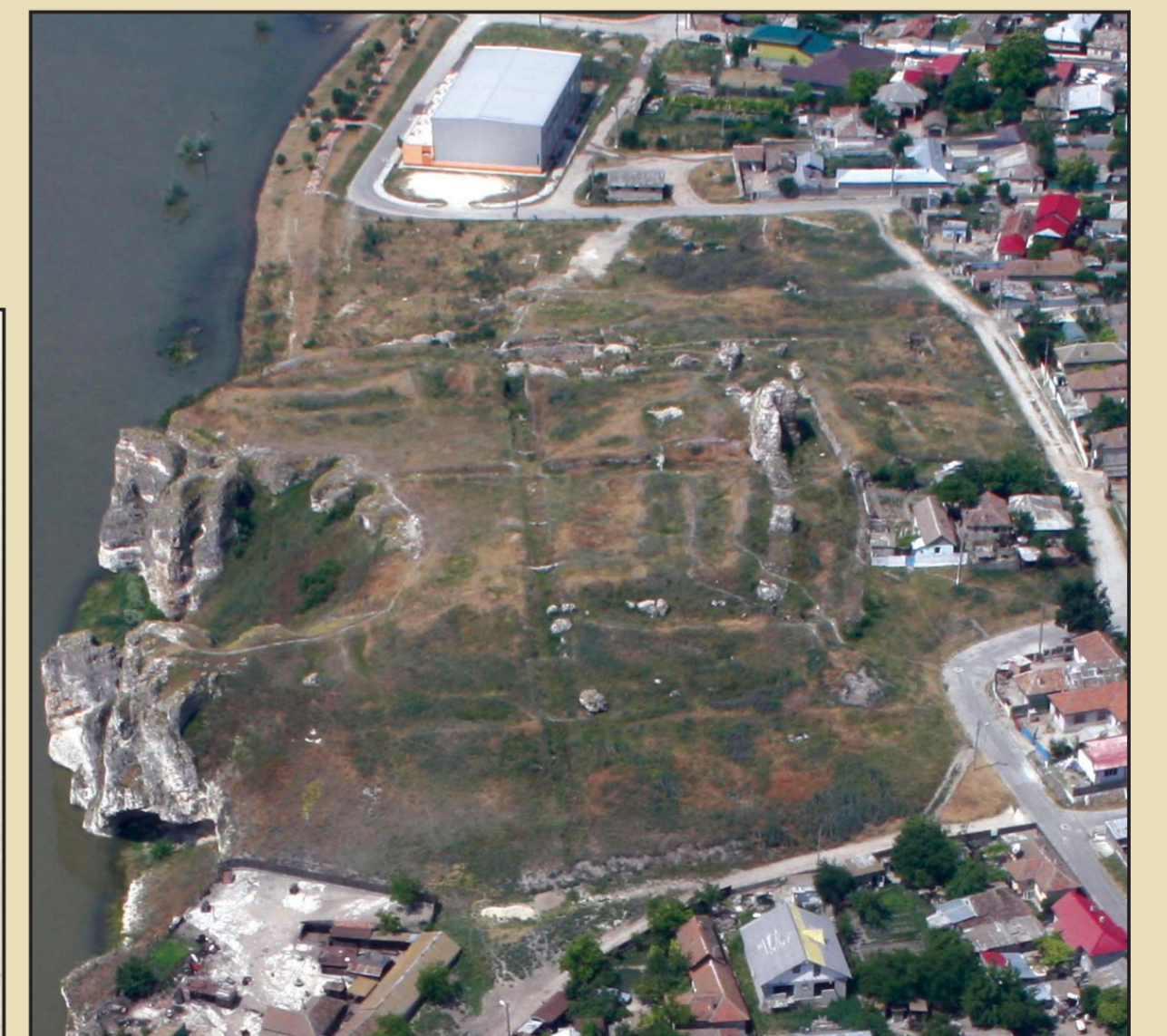
Carsium, imagine aeriană. Foto Mircea Stoian