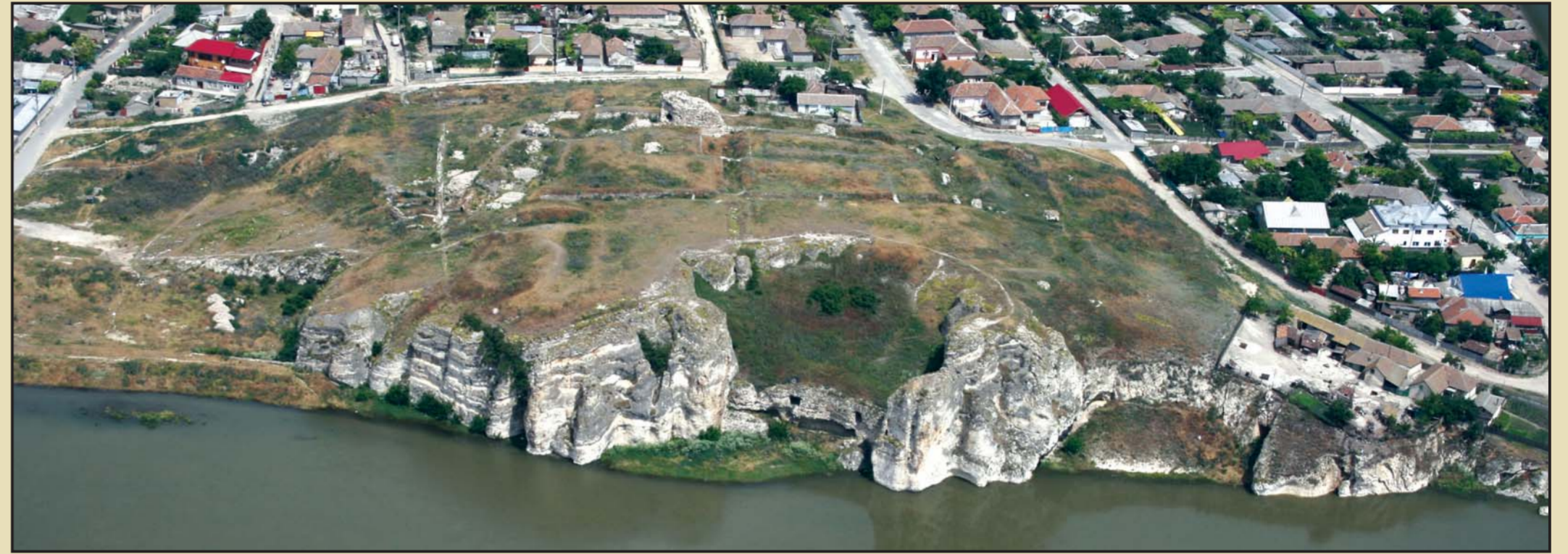
Carsium, Hârșova, jud. Constanța. Vedere aeriană