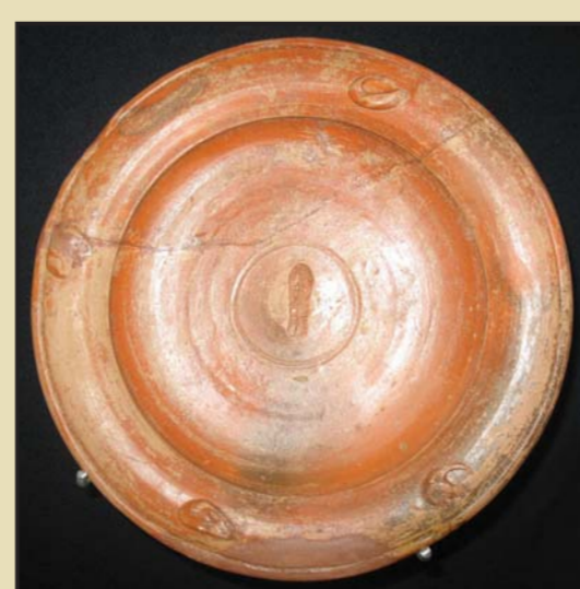
Ceramică romană descoperită la Carsium