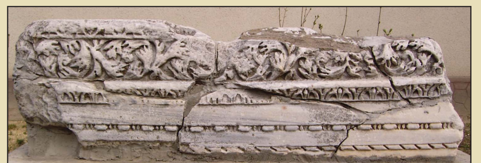
Friză descoperită la Carsium