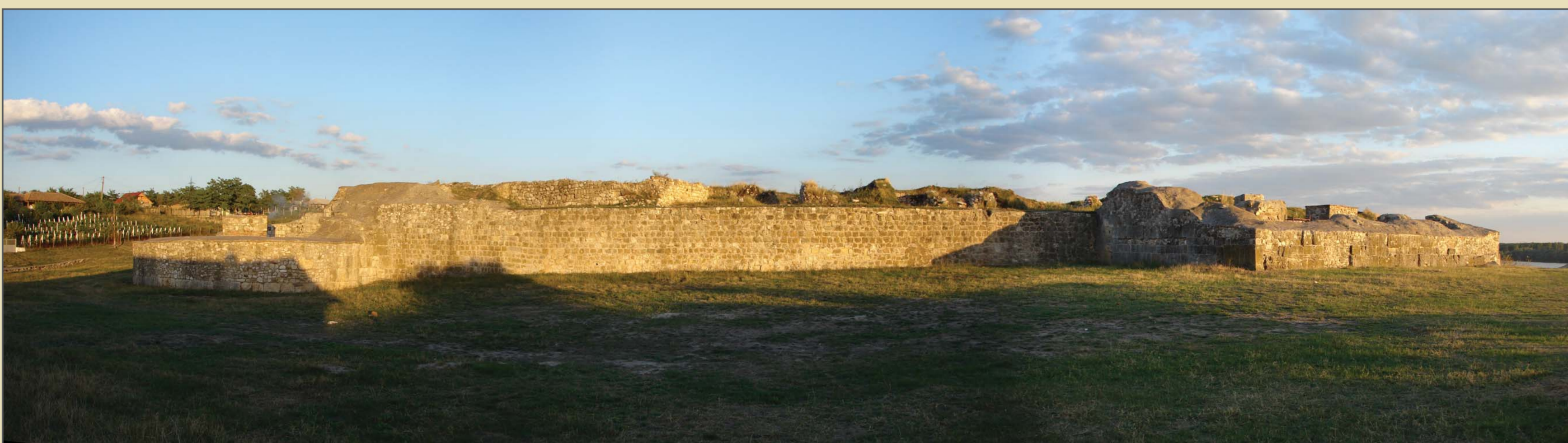
Capidava, com. Topalu, jud. Constanța. Vedere generală