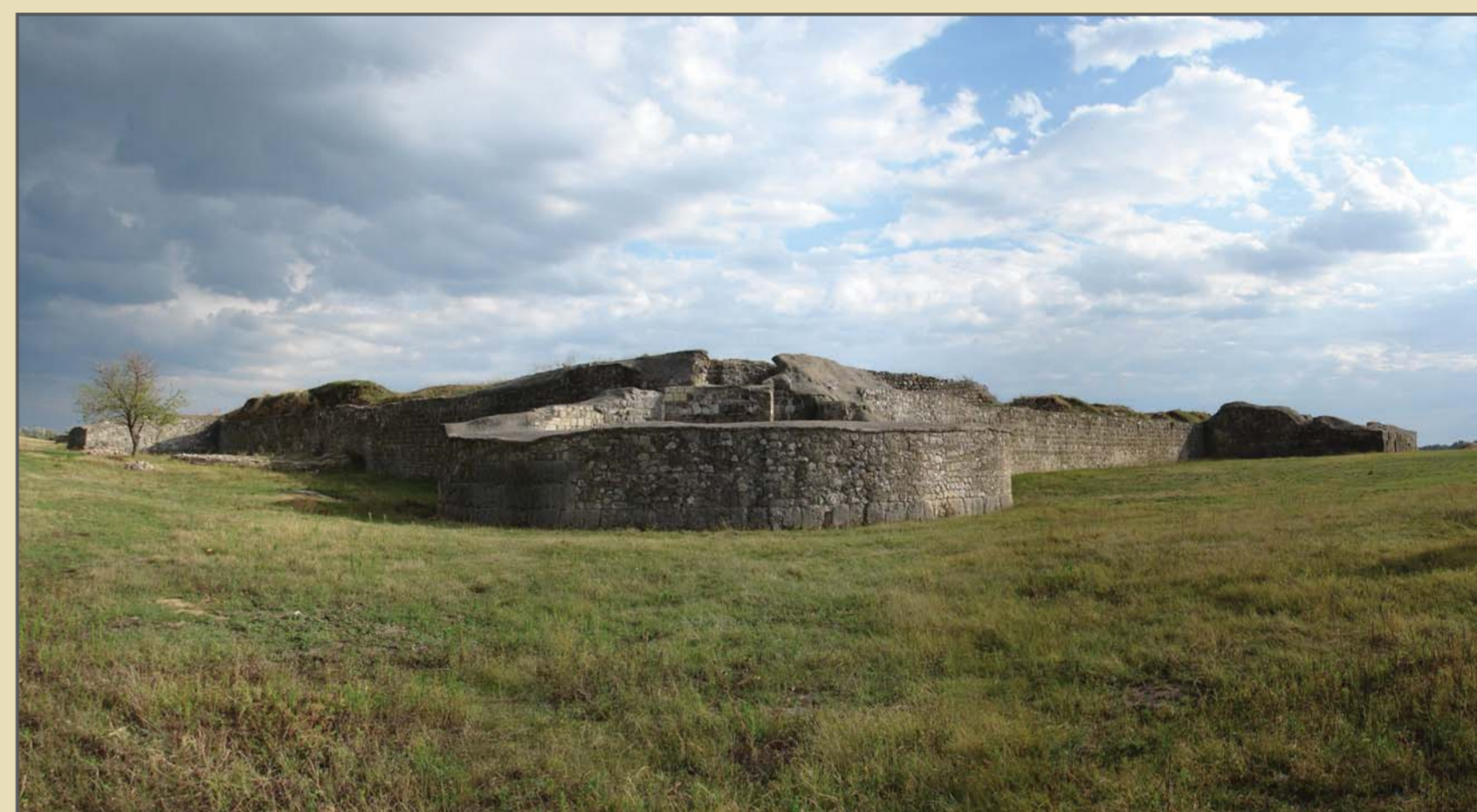
Capidava, com. Topalu, jud. Constanța. Panorama cu turnul de colț 2 în prim-plan