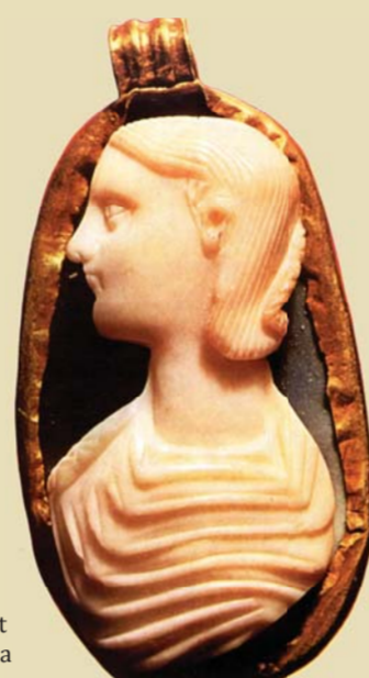
Pandantiv de aur cu camee descoperit la Capidava. Portretul împărătesei Iulia Mammea