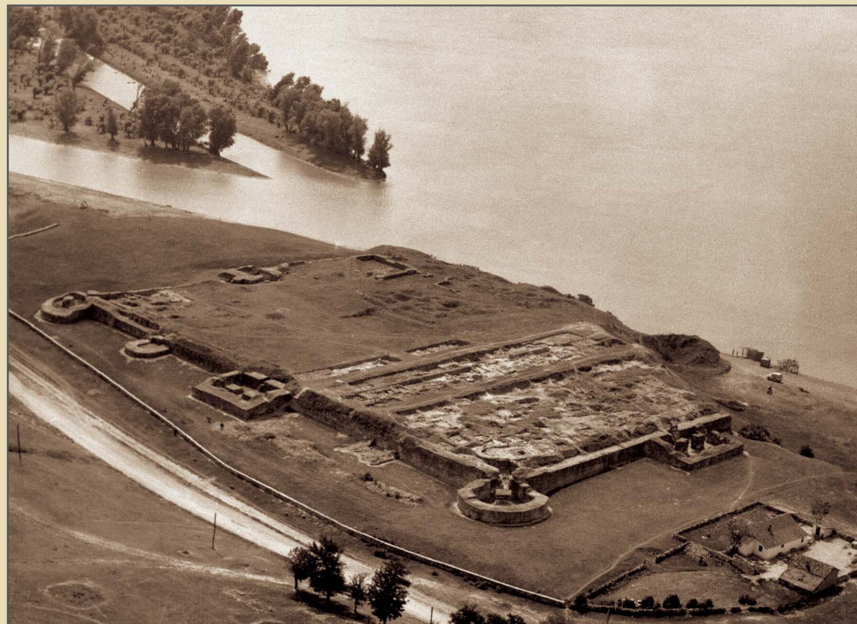
Capidava, com. Topalu, jud. Constanța, vedere aeriană.

Castellum 135 x 115 m, adică cca 1.5 ha, deservind o unitate auxiliară (cohors în epoca Principatului, respectiv vexillatio/ cuneus în epoca Dominatului, conform Notitia Dignitatum). A fost săpat și restaurat integral zidul de incintă, cu 7 turnuri (rectangulare, în formă de evantai și de potcoavă).