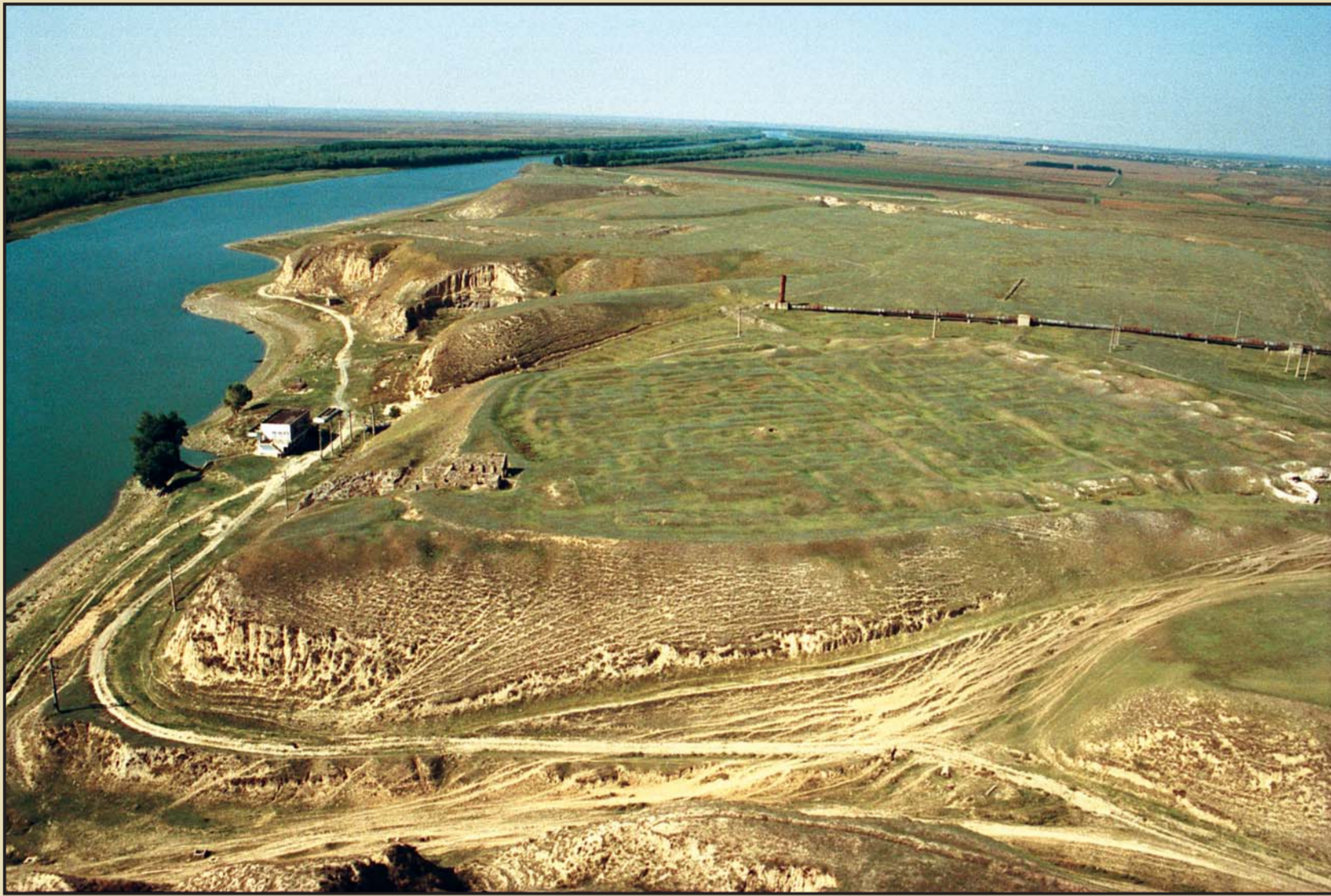
Troesmis, vedere aeriană, Mircea Stoian