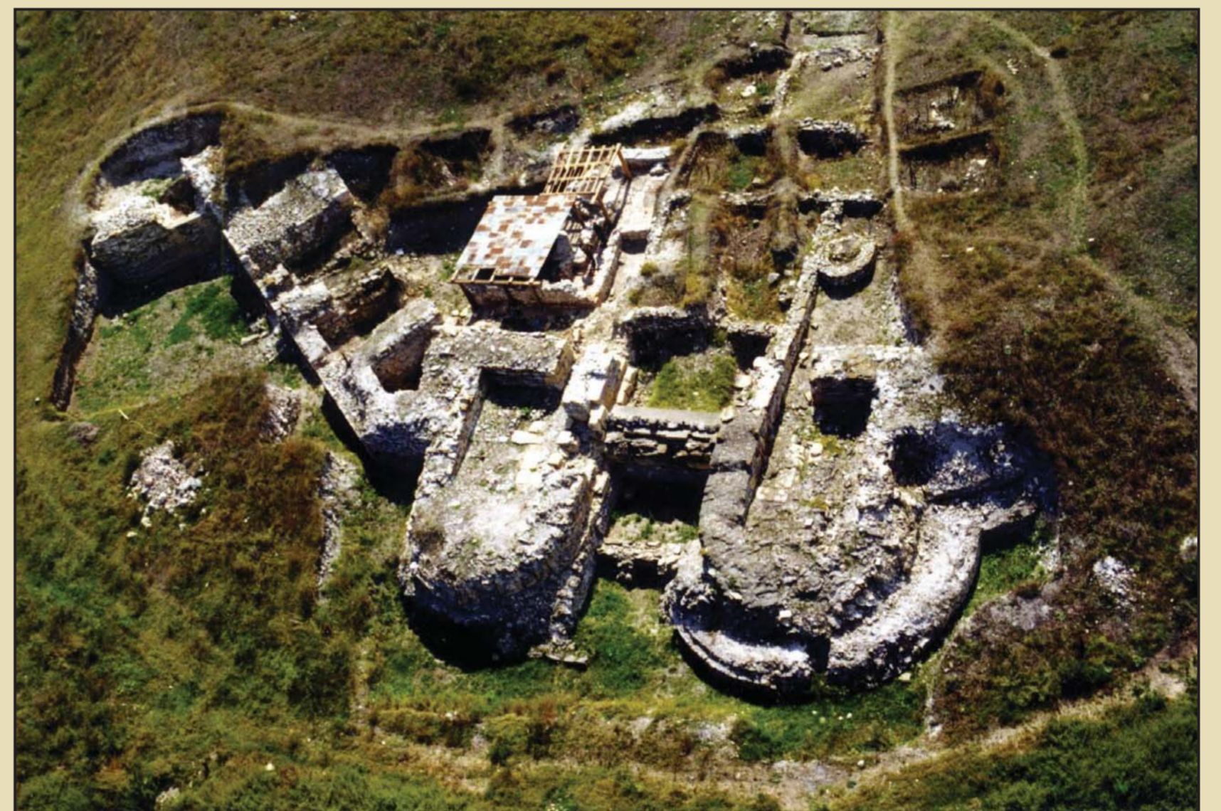
Halmyris, Icem Tulcea

Structura urbană romană s-a extins probabil în continuarea promontoriului, spre SV. Așezarea civilă a fost identificată de recente cercetări arheologice preventive.